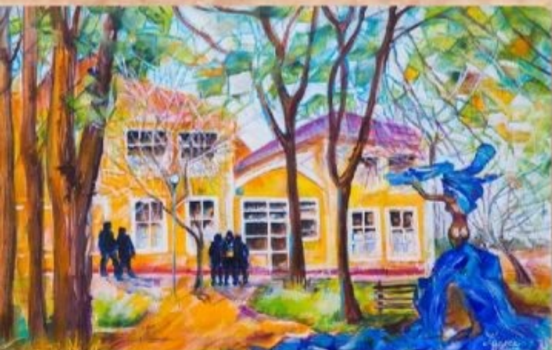
Szentannai Sámuel Középiskola és Kollégium 50 cm x 70 cm, olaj, vászon