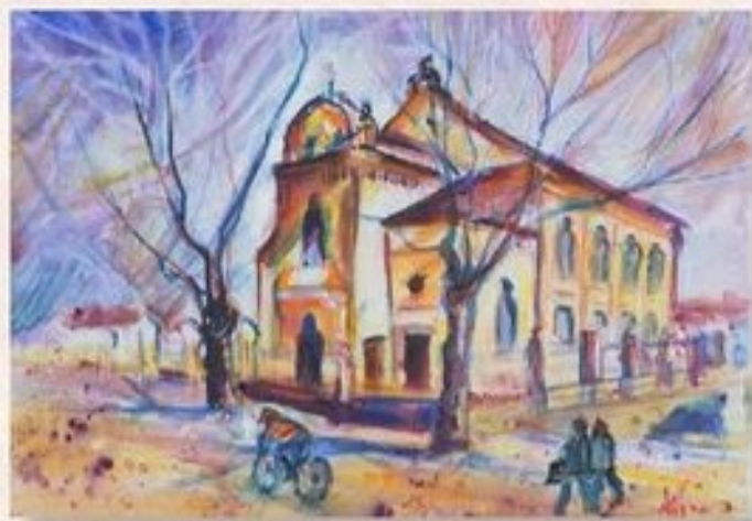
Zsinagóga 30 cm x 40 cm, acryl, vászon

Ha Karcagra Püspökladány, Debrecen irányából a 4. számú főúton érkezünk, utunk a Püspökladányi úton vezet a városközponthoz.