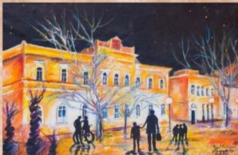
Estifények Karcagfőterén 40 cm x 60 cm, acryl, vászon

A Bíróság épületét Fellner Sándor budapesti műépítész tervezte és építette 1891-ben.