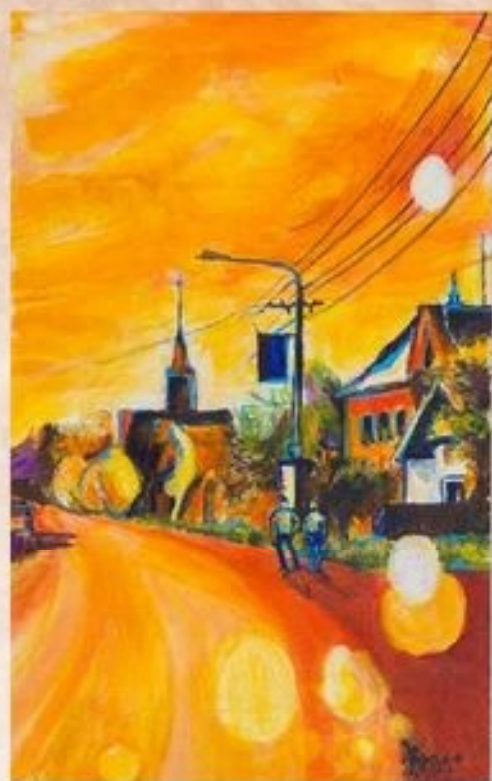
A Püspökladányi úton 34 cm x 19 cm, olaj, festtábla