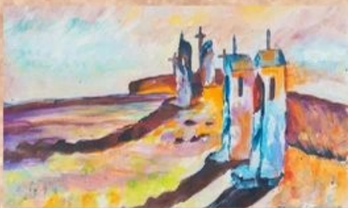
Színek, fények a Kálvária dombon 30 cm x 40 cm, acryl, festőtábla

A Dózsa György út mentén lévő kunhalom tetején, – régi nevén Szőlőshalmon – látható az 1851-ben készült, az egyszerű, klasszicista jellegű, kör alakban elhelyezkedő képfülke-építményekből álló 14 stációs kálvária. A domb tetején három nagyméretű, egyszerű fakereszt, harangláb és a Mária-szobor található. A kálváriát többször felújították, legutóbb 1993-ban. Az építmény festői megjelenésű, a környék meghatározó városképi eleme.