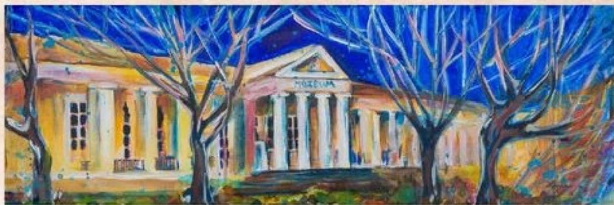
Györfly István Nagykun Múzeum 25 cm x 60 cm, acryl, vászon