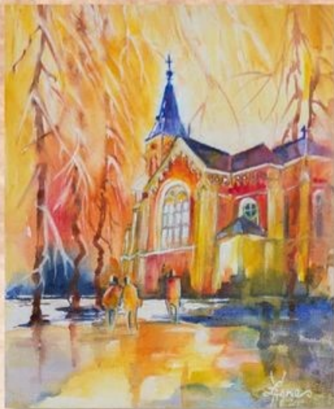
Római katolikus templom 40 cm x 30 cm, acryl, vászon

Az Izraelita Hitközség 1854-ben alakult meg Karcagon, s néhány évtized alatt népes közösséggé fejlődött. A Kertész József utcán álló zsinagógát 1899-ben szentelték fel. Az ezredfordulóra nagyon megfogyott közösség az 1990-es években szépen rendbe hozta a templomot, ami ma már műemlék.