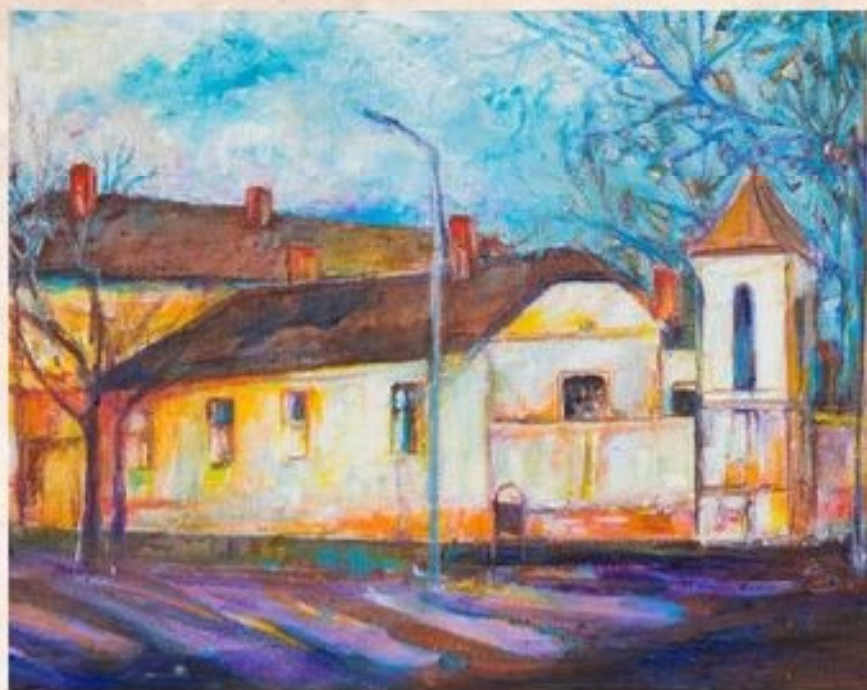
Csengős iskola 40 cm x 50 cm, olaj, vászon

"Elég, hogy kik az országba Tiszta szívet kérdenek, Csak Karcagra a Kúnságba Varró úrhoz jöjjenek." (Csokonai Vitéz Mihály: Visszajövetel az Alföldről)