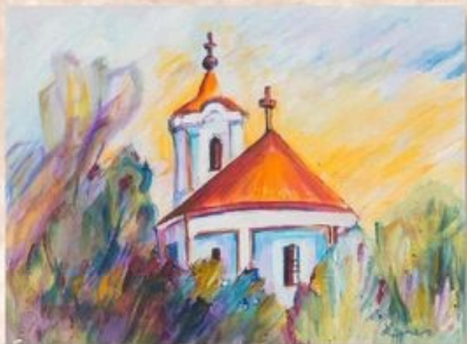
Ortodox templom 30 cm x 40 cm, olaj, vászon

A templom a környéken lakó görög kereskedők anyagi áldozatvállalásával készült el.