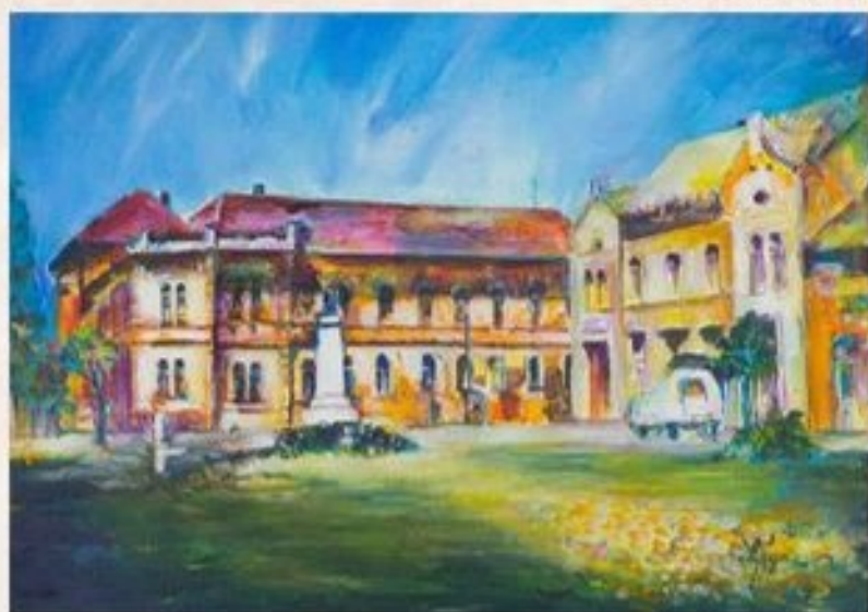
Karcagon 40 cm x 50 cm olaj, vászon

A Petőfi szobor György Dezső szobrászművész alkotása, 1948. augusztus 20-án avatták fel.