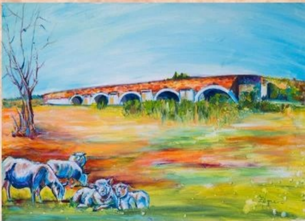
A Zádor hídnál pihenő birkáék 50 cm x 70 cm, olaj, vászon

A legenda szerint a híd köveinek összeragasztásához használt meszet az óriási nádasokból szedett madártojással oltották, ettől lett ilyen erős. A Zádor-híd – akár a későbbi Hortobágyi híd is – kilenc boltívre készült, de az 1830. évi nagy árvíz két-két szélső pillérét elsodorta. A Tisza-szabályozás után elapadtak az errefelé folyó vizek, a Szolnok-Debrecen vasútvonal megépülte (1857) után, pedig az út forgalma is lecsökkent. A híd ma már műemlék. A híd környékén található a Zádor-lapos, természetvédelmi terület.