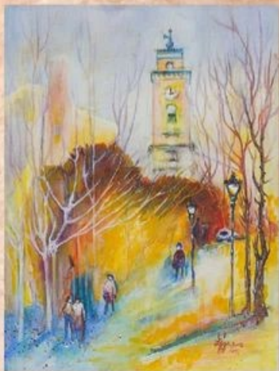
Karcagon, háttérben a református templom 40 cm x 30 cm, acryl, vászon

Kossuth téri református templom. Ezen a helyen 1633-ban már egy korábban épült, itt álló templomhoz építettek tornyot. 1793 és 1797 között Rabl Károly tervei szerint és irányításával újjáépült a templom a toronnyal együtt. Rendkívül szép a háromhajós templom egységes, későbarokk-copf belső tere. A templom 1560 sípval készült orgonája 1866-ból való. Figyelmet érdemel még az ugyancsak copffából készült szószék. A református templom előtt 1935-ben állítottatott Országzászlót Györfi Sándor szobrász újította fel 1996-ban, a Millecentenáriumi évben.