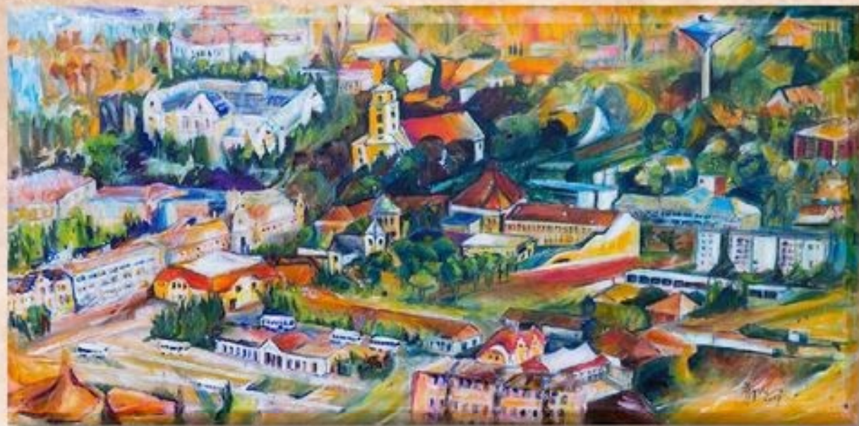
Karcag város a magasból 50 cm x 100 cm, olaj, vászon

Őrizzük és ápoljuk épített és természeti, valamint szellemi értékeinket, büszkék vagyunk az elszármazott híres karcagiakra, elődeink hagyományaira, kultúrájára, páratlan népművészeti értékeinkre.