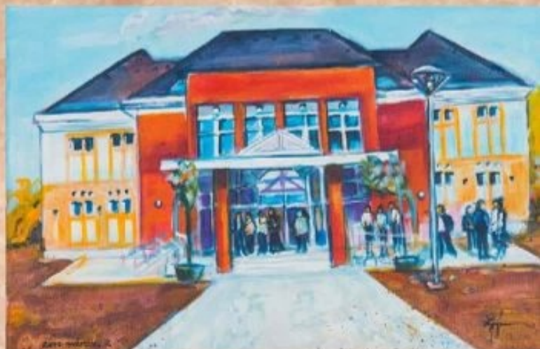
Szentannai Sámuel Középiskola és Kollégium 30 cm x 40 cm, acryl, vászon

Az alföldi gyenge minőségű talaj (szikek) javítása, a fajtanemesítés, a vetőmagtermelés lett a feladata az 1947-ben alapított Karcagi Állami Növénynevelő Telepnek, mely az évtizedek során a Debreceni Agrártudományi Egyetem, ma a Debreceni Egyetem Agrár Kutatóintézetek és Tanyagazdaság Karcagi Kutatóintézeteként vívott ki határokon túli elismerést. A kutató Intézet központi épülete körüli parkot 1985-ben arborétummá minősítették, mintegy 2,5 hektár várja az idelátogatókat. Egy rövid kényelmes sétával körbejárható a fa- és cserjeritkaságokat is tartalmazó a nyári hőségben kellemes hűt biztosító parkerdő. A területén filagória, tűzhely, korszerű teniszpálya várja a látogatókat. Az arborétum gazdag faunájáról tájékoztató tábla ad eligazítást az egyedi fák és cserjék előtt magyar és latin nevet tartalmazó kis táblákról gyűjthet információt a látogató. A főépület mögött található a Nagy Hegyesbori-halom (93,5 m); tetején egy rendezett háromszögelési ponttal, amelynek oldalán rövid leírás/térkép nyújt betekintést a kunhalmok eredetébe.