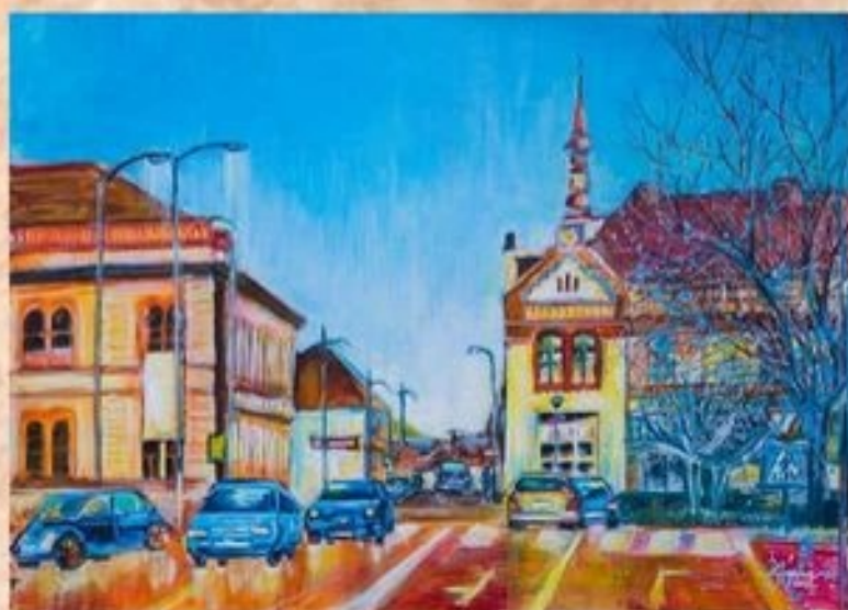
Városközpont, Karcag 50 cm x 70 cm, acryl, vászon