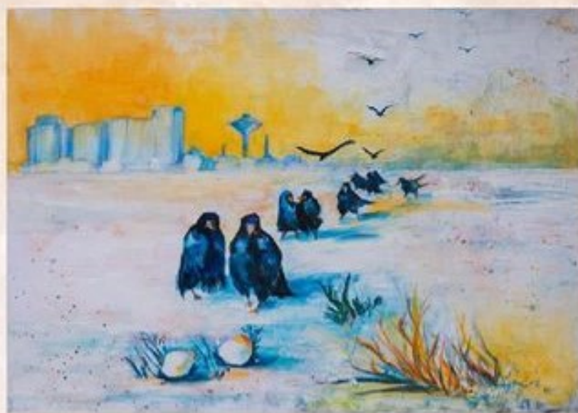
Varjak a karcagi határban 50 cm x 70 cm, olaj, vászon

A Zádor-híd közelében található a Zádor-halom és a Lőzér-halom, távolabb pedig az Ágota-halom és még több kunhalom. A kunhalmokhoz, csárdákhoz, mondák és legendák kötődnek. Az alföldi táj jellegzetes térszínformái a kunhalmok, amelyek közül a legöregebbek a rézkorban alakultak ki. Számos mes-tersegesen emelt halom évezredek óta a lakóhelyek színtere volt, több halom azonban temetkezési helyül, őrhelyül és határjelölő pontként is szolgált.