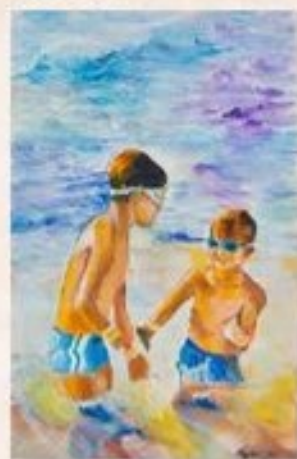
Vidám játék a strandon 34 cm x 19 cm, olaj, festőtábla

A strand mellett található a Karcag – Tiszafüred vasútvonal első állomása a Karcagi Vásártéri megálló. Ha Berekfürdőbe, vagy Tiszafüredre szeretnénk eljutni, akkor itt megálló villanykocsikkal – a „Kis pirossal” – tehetjük ezt meg.