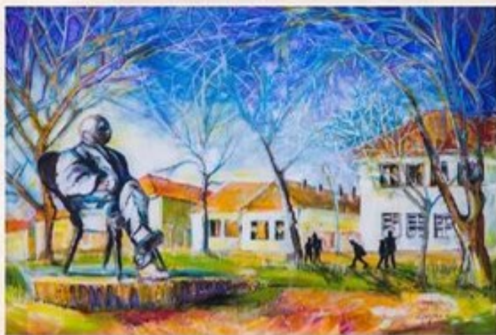
Györfly István néprajzkutató szobránál 50 cm x 70 cm, acryl, vászon

Györfly István (1884-1939) karcagi születésű néprajztudós, akadémikus, a Nagykunok népeletemének jeles kutatója. Halála után hálás tanítványai létrehozták a róla elnevezett Györfly Kollégiumot. A múzeum bejáratától balra látható vörösmárvány reliefjét Papi Lajos kisújszállási szobrászművész készítette 1974-ben. Nagyméretű ülő alakos szobra a múzeum előtti parkban Györfly Sándor alkotása. 1984-ben avatták fel.