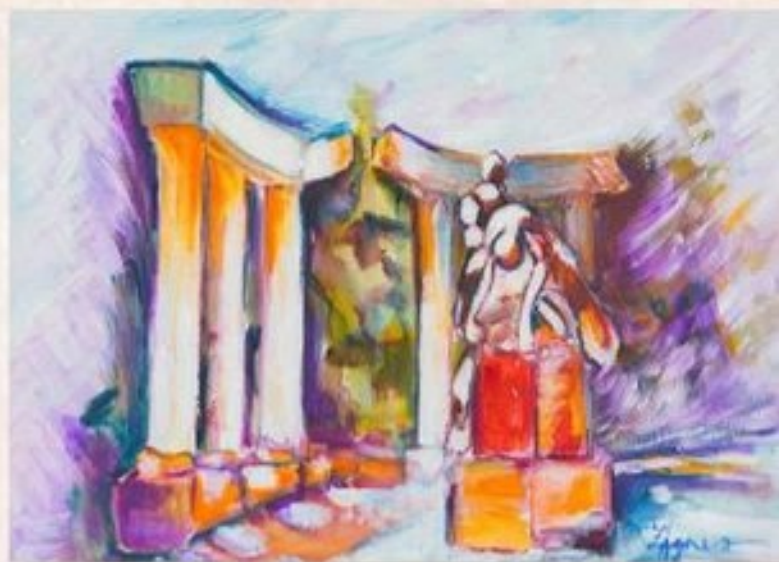
A II. Világháborús emlékmű 30 cm x 40 cm, acryl, vászon