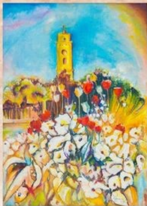
A Református templom tornya 50 cm x 40 cm, olaj, festőtábla

A Nádor oszlop. A város legrégebbi köztéri alkotását József nádor 1805. évi karcagi látogatásának emlékére a nagykun városok állították a református templom mellett, 1808-1809 körül. Többször lebontották, a jelenlegi oszlopot a Karcagi Nagykun Városvédő Egyesület 1997-ben állította.