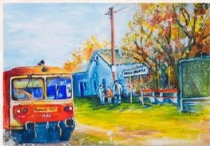
Megjött a Kis Piroska 50 cm x 70 cm olaj, vászon