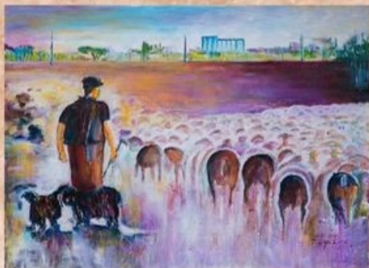
Birkanyáj Karcag határában 50 cm x 70 cm, olaj, vászon

Az északi temetőben áll a XVIII. században épült csőszház. A „T” alaprajzú veremházat putriszerűen félig a földbe süllyesztették. Ez a megoldás régészeti ásatások tanúsága szerint a középkorig vezethető vissza. A ház falazata vályog nyeregteteje náddal fedett. A bejáratot közepén egy a „T” alak szárát képező épületrész, az ún. gádor alkotja. A „T” alak két szárnyában egy-egy kis szoba van közöttük a gádor tengelyében kemence található; fölötté egykor fakémény volt. Az egykori csőszház ma jelenleg magántulajdonban van.