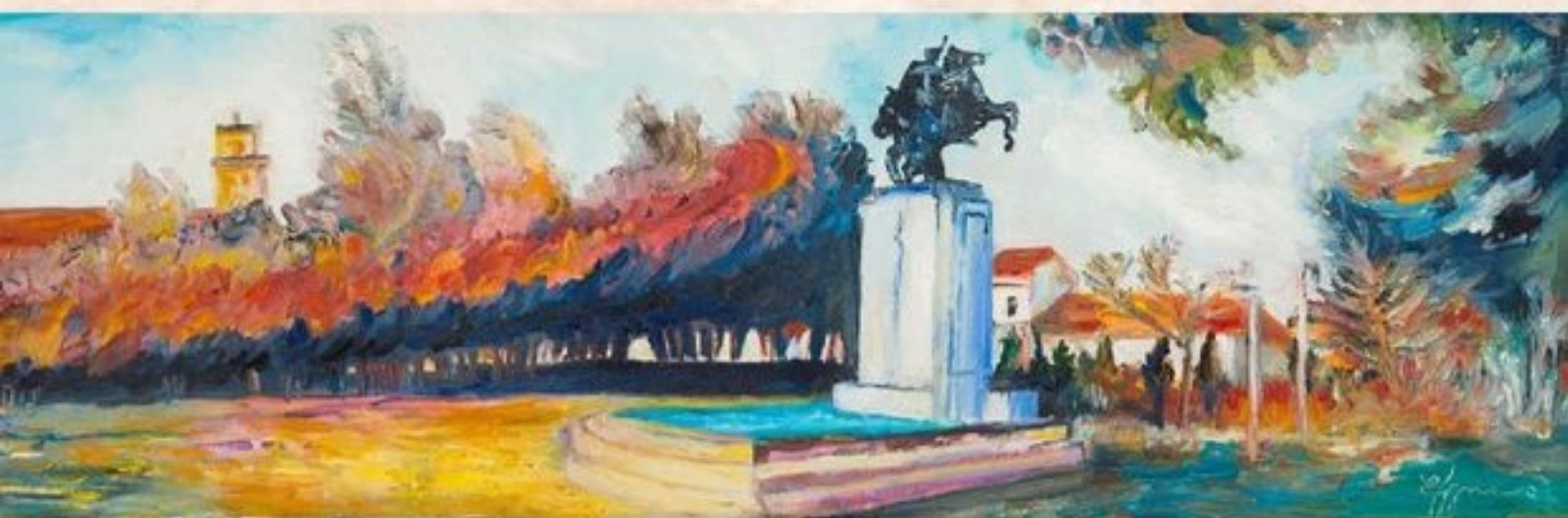
I. Világháborús emlékmű 20 cm x 60 cm, acryl, vászon