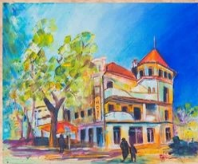
Hotel Nimród 30 cm x 40 cm, acryl, vászon

A Városháza mellett található az igen impozáns tömbje a Nimród**** Bioszálloda, Bioétterem és Biobolt épületének. A 2008-ban megnyílt szálloda folyamatosan várja vendégeit.