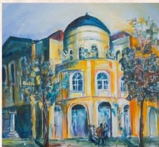
Déryné Kultúrpalota 40 cm x 40 cm, olaj, vászon

Kezdjük sétánkat a Dózsa György út és a Déryné utca sarkán álló, az 1925-26-ban épült kétemeletes, eklektikus épülettől, a Kultúrpalotától. Eredetileg mozi- és színházterem, kiállító-helyiség, könyvtár és étterem működött benne. Ma a Déryné Kulturális, Turisztikai, Sport Központ és Könyvtár székhelye, a város információs és kulturális központja. A főbejárati homlokzaton lévő timpanon mezejében egy Pegazust és egy színészmaszkot ábrázoló szoborcsoport van. Az épülettel szemben található a Nagykun Látogatóközpont.