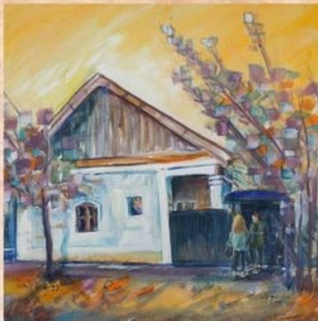
Kántor Sándor Fazekasház 40 cm x 40 cm, acryl, vászon

A múzeum mögötti parkban található a karcagi születésű dr. Mándoky Kongur István (1944-1992) neves karcagi turkológust ábrázoló relief. Györfi Sándor alkotását 1993-ban avatták fel.