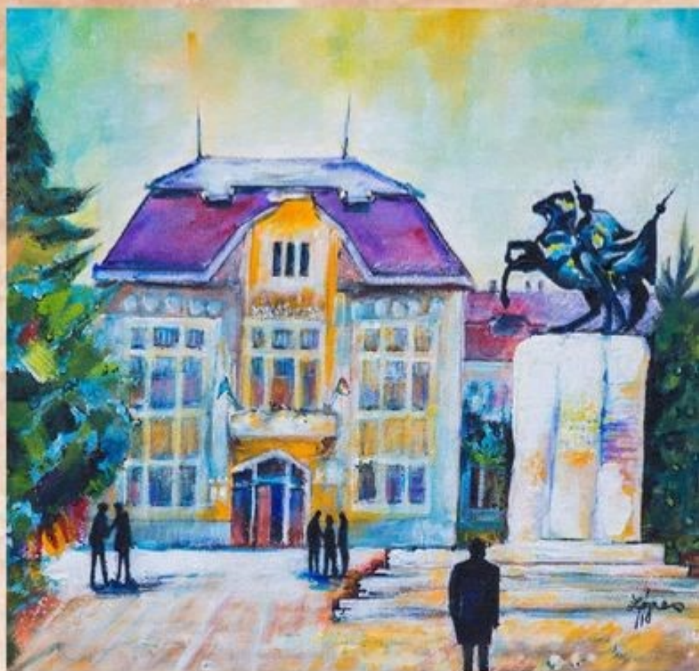
Karcag Városháza 40 cm x 50 cm, olaj, festőtábla

A Városháza főbejáratával szemben áll az I. világháború hősi halottainak emlékműve. A lovas szobor az 1745-ben létrehozott, s egészen az I. világháborúig fennállott jászkun huszárezred katonáját ábrázolja. Alkotója Gáldi Gyula szobrászművész.