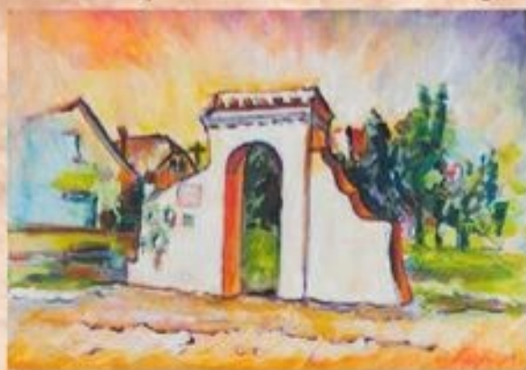
Kováts Mihály emlékkapu 30 cm x 40 cm, acryl, vászon