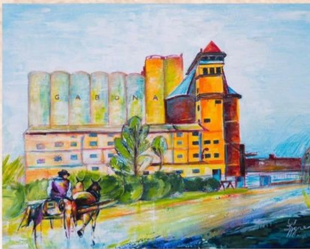
Kifelé a városból a Kisújszállási úton 50 cm x 70 cm, olaj, vászon

Itt találjuk – szép park közepén – a Szentannai Sámuel Középpiskola, és Kollégium épület-együttesét. Az egykori földművesiskolát 1899-ben alapították, céljaira a közbirtokosság 300 hold gyengébb minőségű földet biztosított. Szentannai Sámuel igazgató vezetésével ezeken a területeken folytak először talajjavító kísérletek. A Múzeuma az iskola parkos területén, egy felújított régi szolgálati lakásban kapott helyet. Nemcsak az iskola történetét tárja a látogatók elé, de a kun-sági gazdaszélet szakmai érdekességeibe is bepillantást enged a gyapjú- és patkógyűjtemény, vagy az egykori diákok által készített makettek segítségével. A múzeumban természetesen kiemelt szerepet kap a névadó kutató mezőgazdász Szentannai Sámuel emlékének bemutatása is.