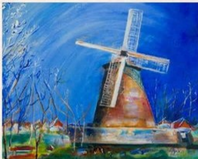
Szélmalom 40 cm x 40 cm, acryl, vászon

„Értünk Kunság mezein ért kalászt lengettél,” írta Kőlcsey Ferenc nemzeti imádságunkban, a Himnuszban. A Nagykunságban termett kiváló sikértartalmú búzából a lisztet egykor a város szárazmalmaiban őrölték. A holland típusú szélmalmok az 1840-es évektől jelentek meg, de a gőzmalmok még abban az évszázadban kiszorították őket. A Vágóhid utca 22. szám alatt fennmaradt 1859-ben épült Gál Ferenc – Gál Szabó Lászlóné – Deák György-féle szélmalom ipartörténeti műemlék, ma múzeumként működik. Az ott kiállított tárgyak, emlékek a szélmolnárok mesterségét idézik. A napjainkig épen maradt szélmalom épülete 6 szintes, forgó tetőrészsel és négy széllappal készült, négyemeletes tornyos, vagy holland típusú szélmalom.