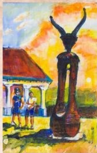
A Szélmalmi fogadóház udvarán 34 cm x 19 cm, olaj, festőtábla

A Szélmalommal szemben található a Hortobágyi Nemzeti Park déli fogadókapuja, az 1997-ben épült Szélmalmi Fogadóház, mely a karcagi jómódú redemptusok házának mintájára épült. A hátsó épületrész előtt szőlő oszlopokkal alátámasztott ötnyílású tornác van. Az épületben kapott helyet a védett területek növény- és állatvilágát bemutató kiállítás. A Fogadóház a kerékpáros túraútvonalak kiinduló állomása, udvara a turistacsoportok pihenőhelyeként működik, szalonasütésre, bográcsozásra, az udvari kemencében sütésre-főzésre is van lehetőség.